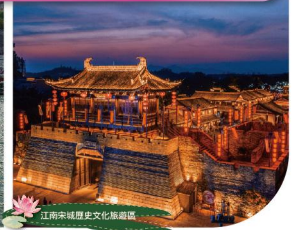
江南宋城歷史文化旅遊區