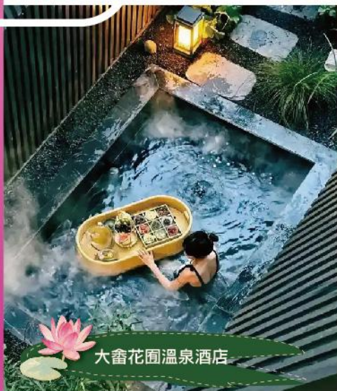
大畚花園溫泉酒店