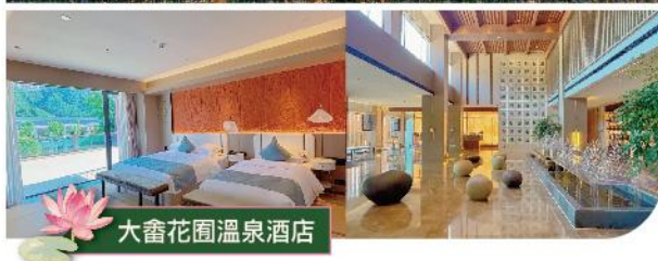
大畚花園溫泉酒店