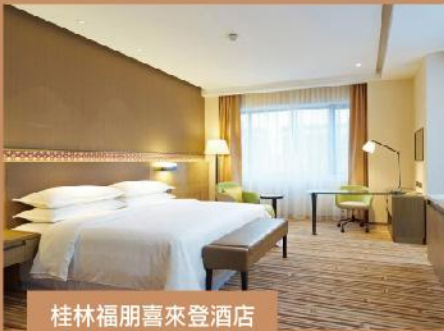
桂林福朋喜來登酒店