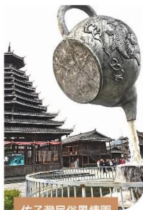
佑子灣民俗風情園