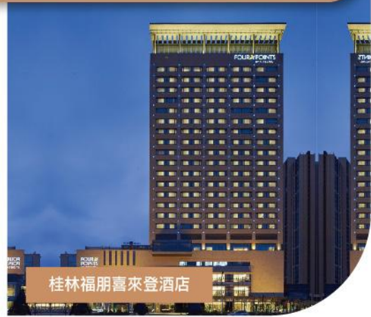
桂林福朋喜來登酒店