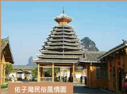
侗子灣民俗風情園