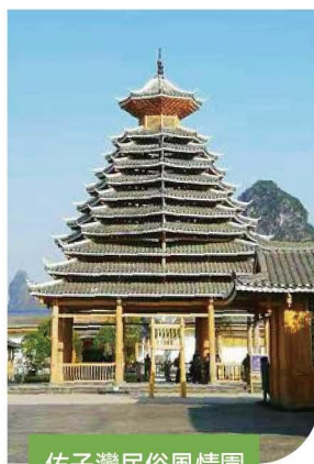
佑子灣民俗風情園