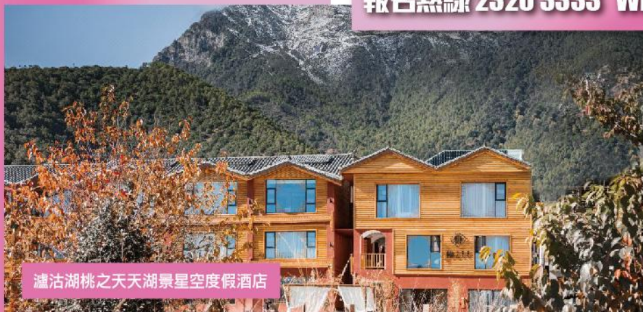
瀘沽湖桃之天天湖景星空度假酒店