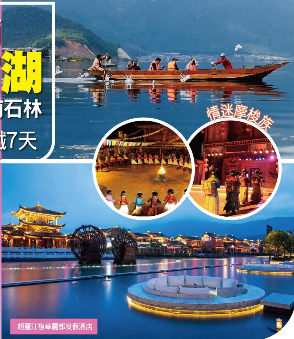
超麗江複華麗郎度假酒店