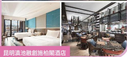
昆明滇池融創施柏閣酒店