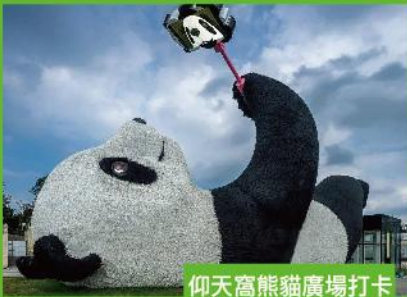
仰天窩熊貓廣場打卡