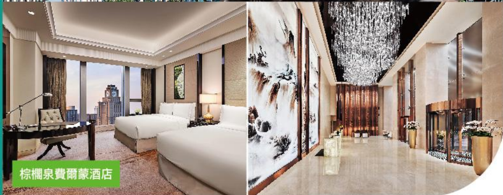
棕櫚泉費爾蒙酒店