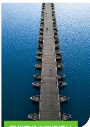
贛州宋代古浮橋遺址