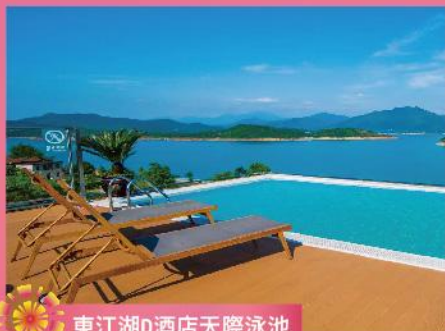
東江湖D酒店天際泳池