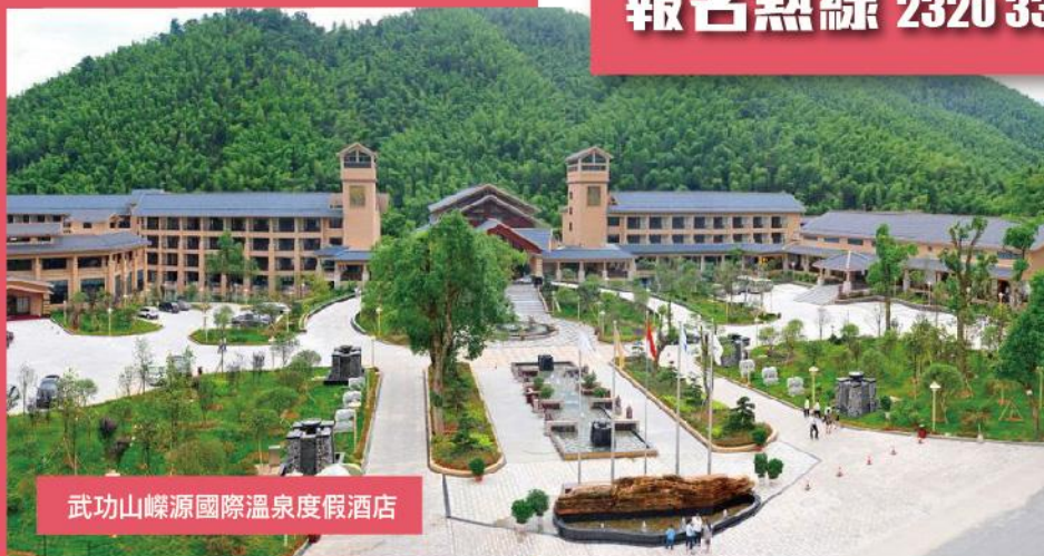
武功山嶸源國際溫泉度假酒店