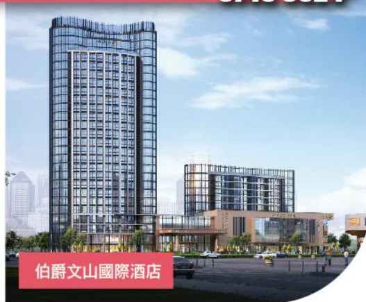
伯爵文山國際酒店