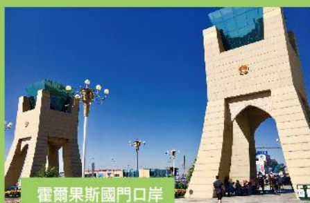
霍爾果斯國門口岸