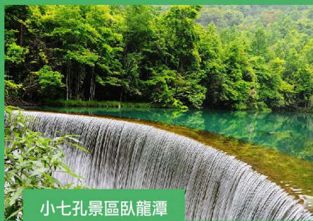
小七孔景區臥龍潭