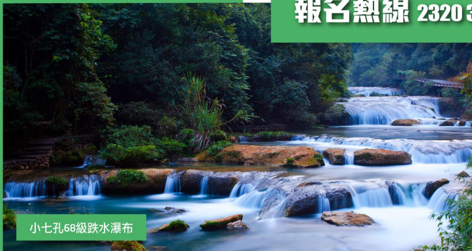
小七孔68級跌水瀑布