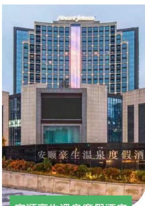
安順豪生溫泉度假酒店