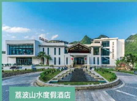
荔波山水度假酒店