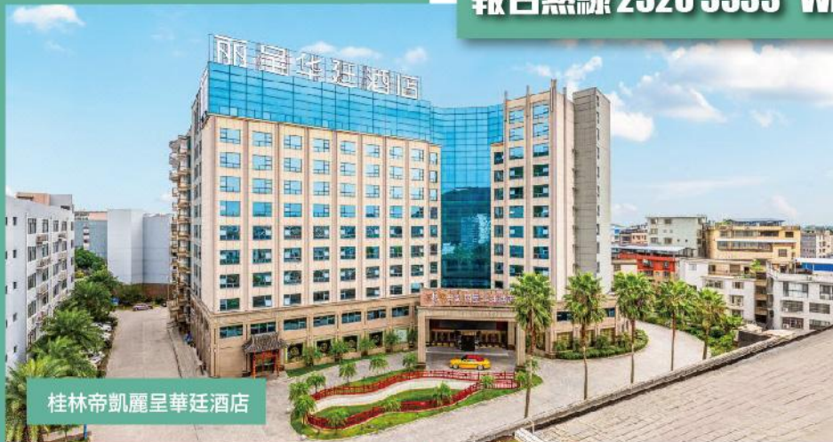
桂林帝凱麗呈華廷酒店