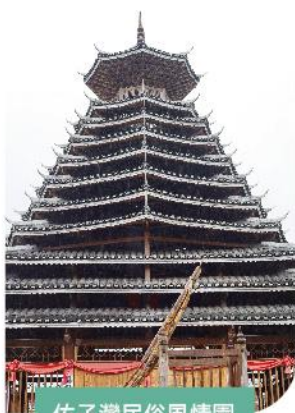
佑子灣民俗風情園

品嚐 羅城 長桌宴 貴州特色苗家酸湯宴 廣西十大名菜【荔浦芋頭宴】 南丹特色【火塘宴】