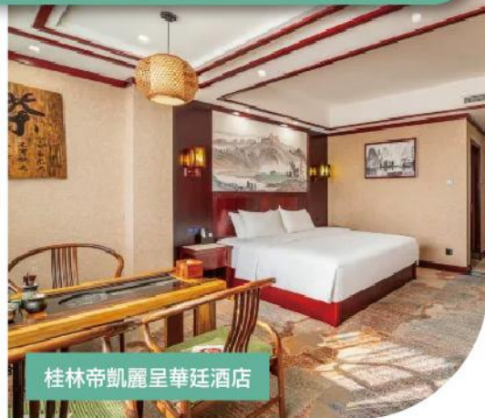
桂林帝凱麗呈華廷酒店