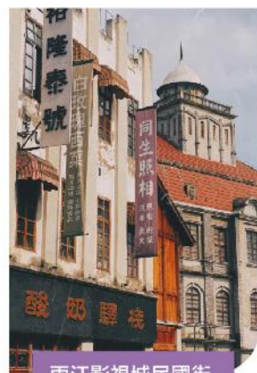
兩江影視城民國街