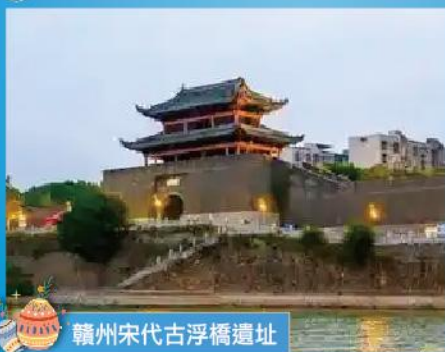
贛州宋代古浮橋遺址