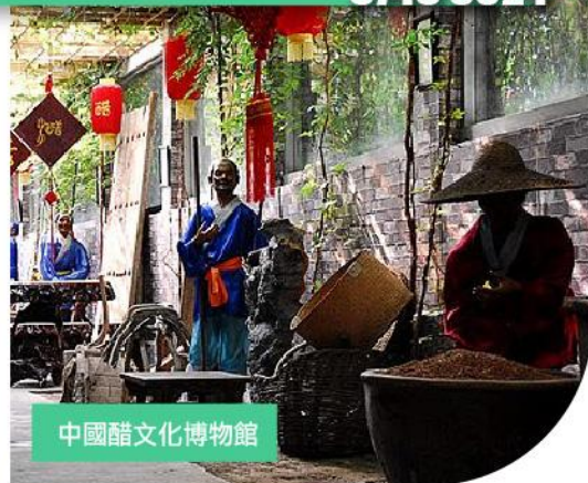
中國醋文化博物館