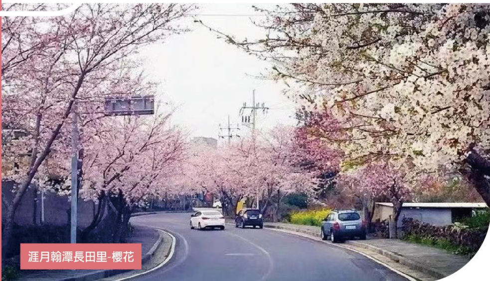
涯月翰潭長田里-櫻花