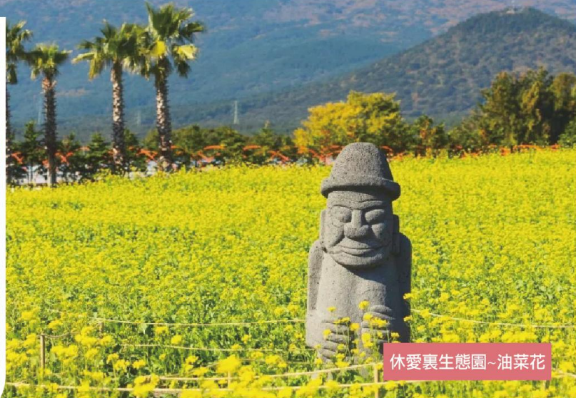
休愛裏生態園-油菜花