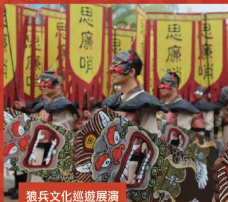
狼兵文化巡遊展演