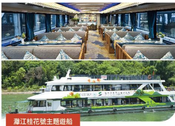
灘江桂花號主題遊船

品嚐 貴州特色【苗家酸湯宴】 廣西十大名菜【荔浦芋頭宴】 南丹特色【火塘宴】 羅城長桌宴