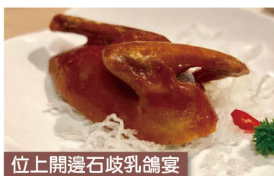
位上開邊石岐乳鴿宴