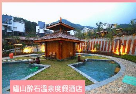
廬山醉石溫泉度假酒店