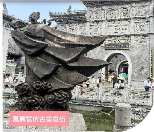
萬壽宮仿古美食街