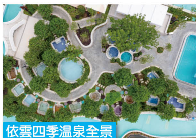
依雲四季溫泉全景