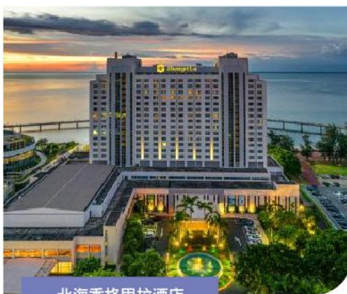
北海香格里拉酒店