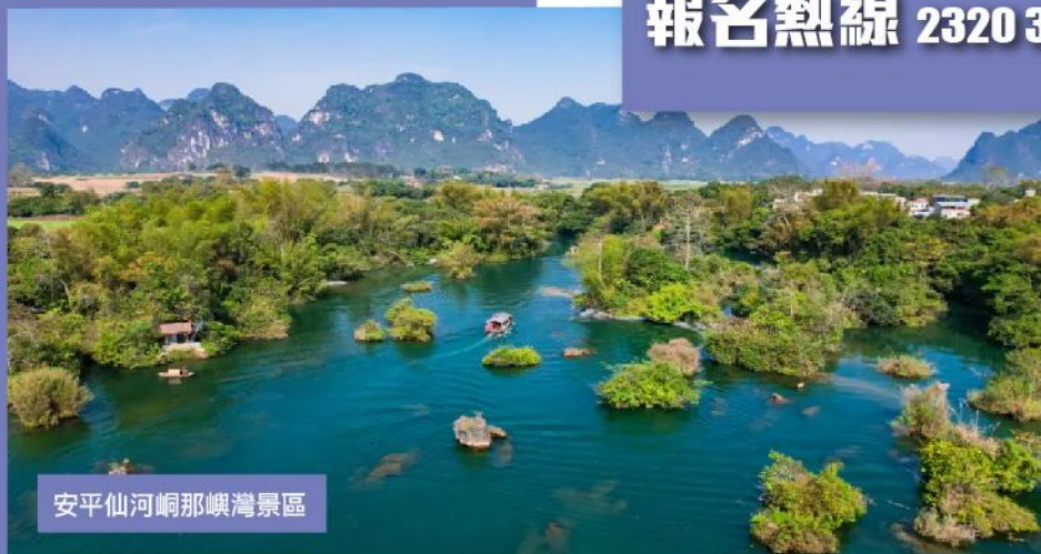
安平仙河峒那嶼灣景區