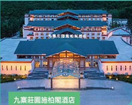
九寨莊園施柏閣酒店