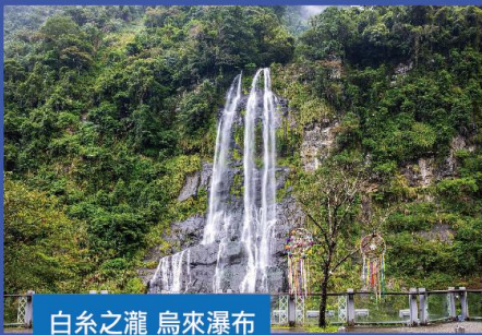
白系之瀧 烏來瀑布