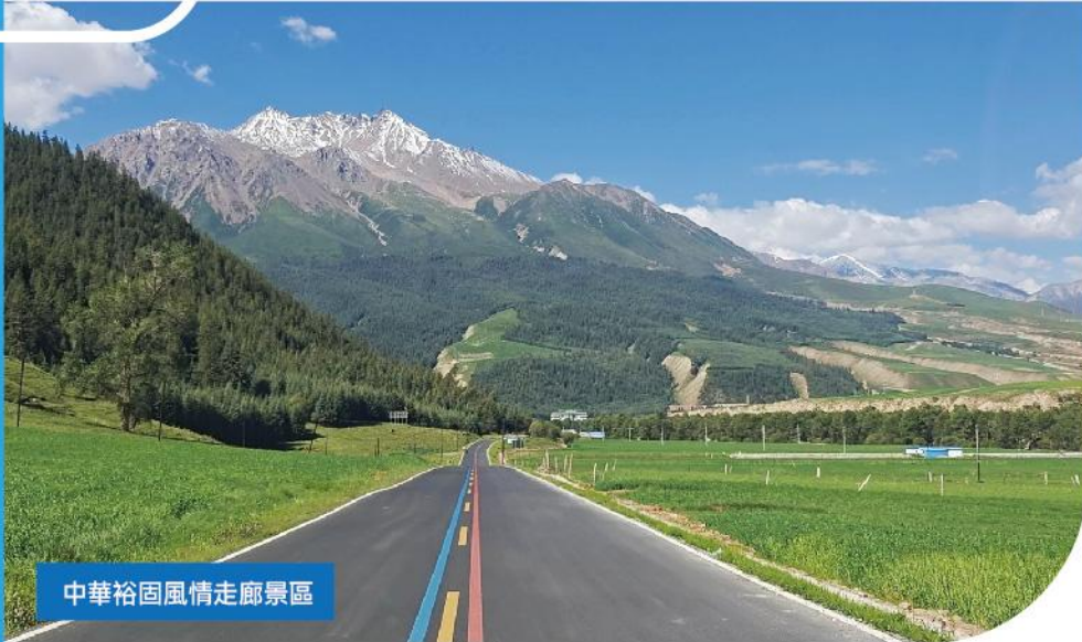
中華裕固風情走廊景區