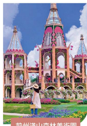
荊州淺山森林美術園