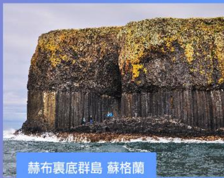
赫布裏底群島 蘇格蘭