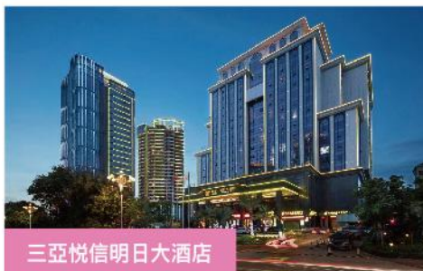
三亞悦信明日大酒店