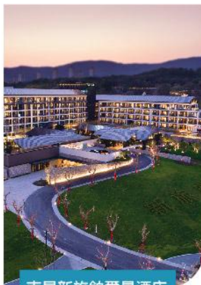
南昌新旅鉅爾曼酒店

住宿 保證入住國際品牌5星 南昌梅嶺新旅鉅爾曼酒店 特色迎賓晚宴【佘族八大碗】 以及佘族特色服裝體驗 萬壽宮新春小吃集市