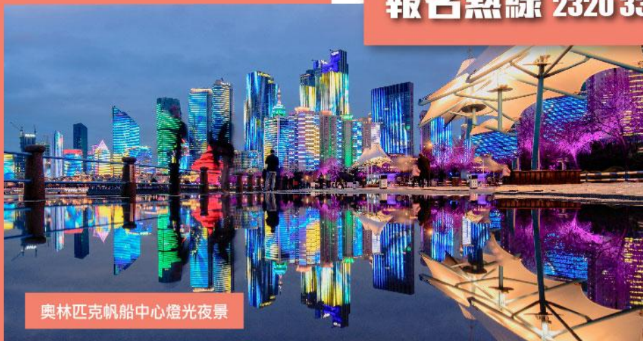
奧林匹克帆船中心燈光夜景