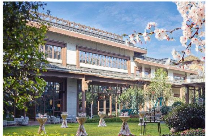
昆明 滇池融創施柏閣酒店