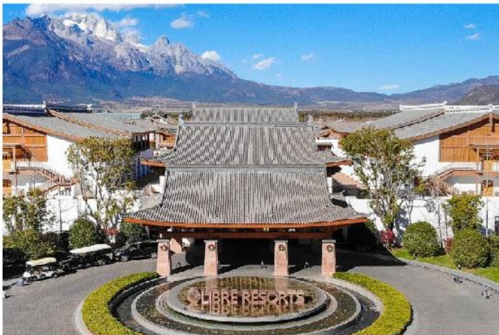
麗江 複華麗郎度假酒店