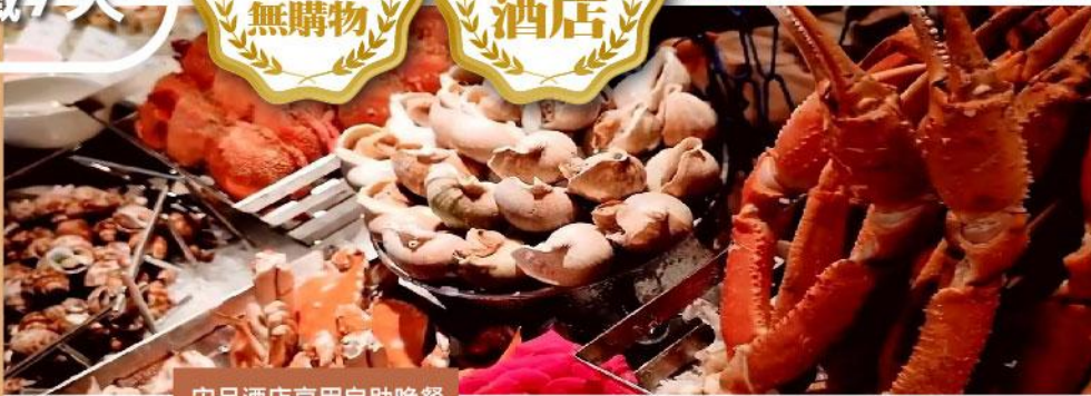
宋品酒店享用自助晚餐