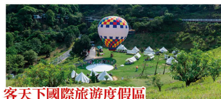
客天下國際旅遊度假區