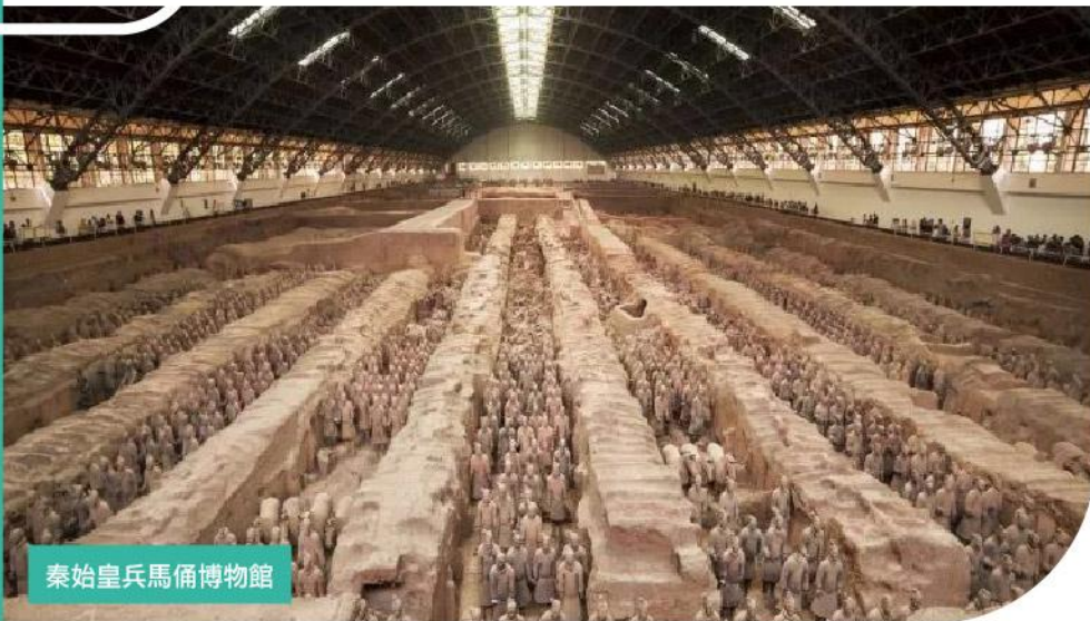
秦始皇兵馬俑博物館